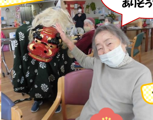
獅子舞と記念撮影

デイサービスでは1月1日～3日の間、獅子舞との記念撮影やお正月にちなんだゲームなどをして賑やかで楽しい新年を迎えました。